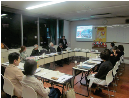
厚木のイベント案です。

東京タワーを応援しています、東京タワーを親子手を繋いで600段の階段を上るイベントをやっています。上まで約20分かかります